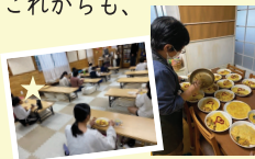
どきスタッフの手作り夕食