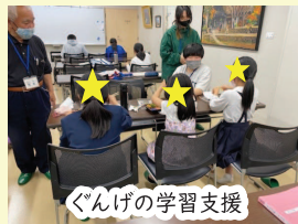
ぐんげの学習支援