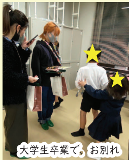
大学生卒業で、お別れ