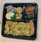
4月~「しほみさんのお弁当」

また、何年間でもさかのぼって、つまづいている部分を集中的に復習することで、その一つの学習内容が全問正解できた姿も見ることができ、お家の方や子どもたちと共に喜びました。これからも、学年の枠を超えて自由に学んでいける、まなび家ならではのよさを生かして、一人一人にあった学習、求める子には上の学年の学習を先取りすることもいとわず、それぞれの子どもの心の中に、小さな自信や喜びの種をまいていきたいと頑張っ参ります。