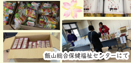
飯山総合保健福祉センターにて