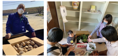
じゃがいも ・ほうれん草