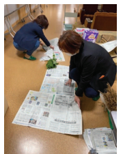
ボランティアで お手伝い頂きました!!