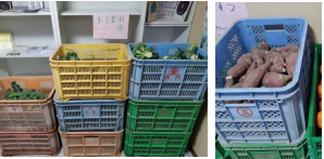
ブロッコリー・さつまいも