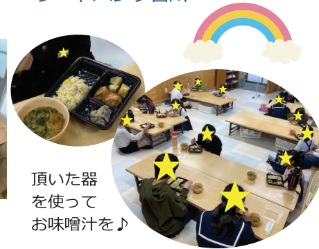
頂いた器を使って お味噌汁を♪