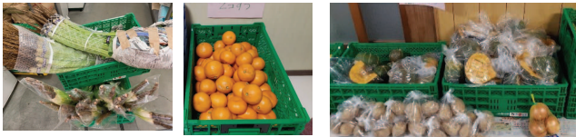
はごぼう・みかん