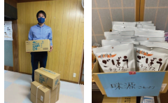
サバチ・ごぼうチップス