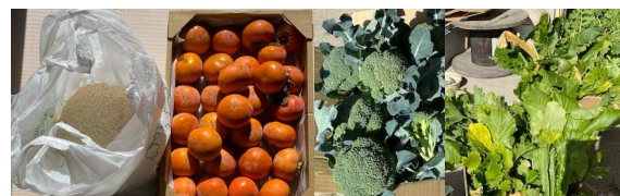
柿・米・野菜類・黒豆・おむつ・ミルク・玩具・洋服