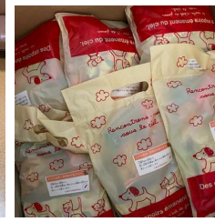
玄米・ビスケット・お菓子セット