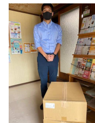
サバチ・バナナチップ