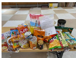
お菓子や食材セット