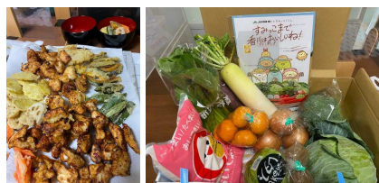
お米と野菜セット