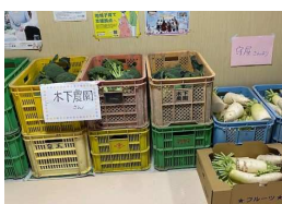
ブロッコリー・大根