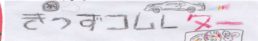
【発行】認定NPO法人さめきっすコムシアター 広報事業部