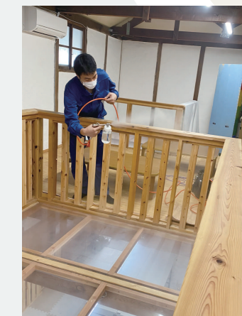
施工提供：(株)四国テクニカ様