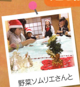
野菜ソムリエさんと